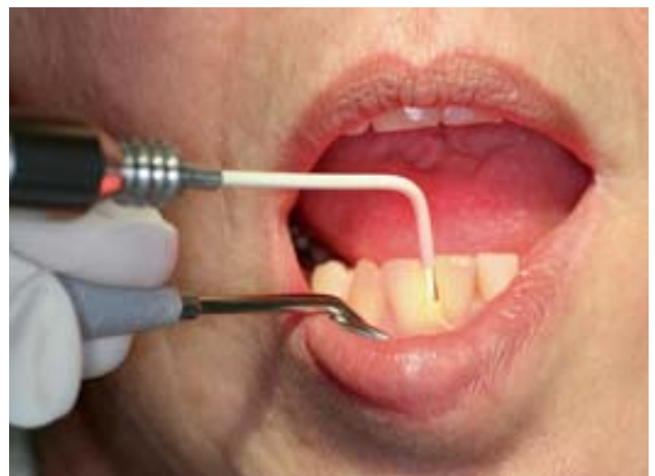
Punktuell wird am Zahnbett der lichtempfindliche Farbstoff mit Laserlicht aktiviert, wobei aktiver Sauerstoff freigesetzt wird, der die Bakterienzellmembran zerstört.

Wie die Sauerstoff-Ozontherapie ist die PDT eine wertvolle Bereicherung bei der Behandlung von Zahnfleischerkrankungen und kann als Alternative zu Antibiotika dienen.