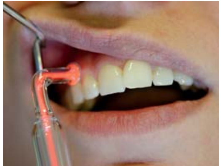
Mit einer Glassonde wird das Sauerstoff-Ozongemisch produziert und den betroffenen Stellen des Zahnbettes zugeführt.

wirkungsvolle Behandlungsunterstützung, die den Einsatz von Antibiotika überflüssig machen kann.