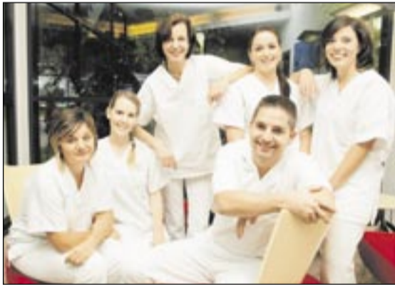
Team des hauseigenen zahntechnischen Meisterlabors.