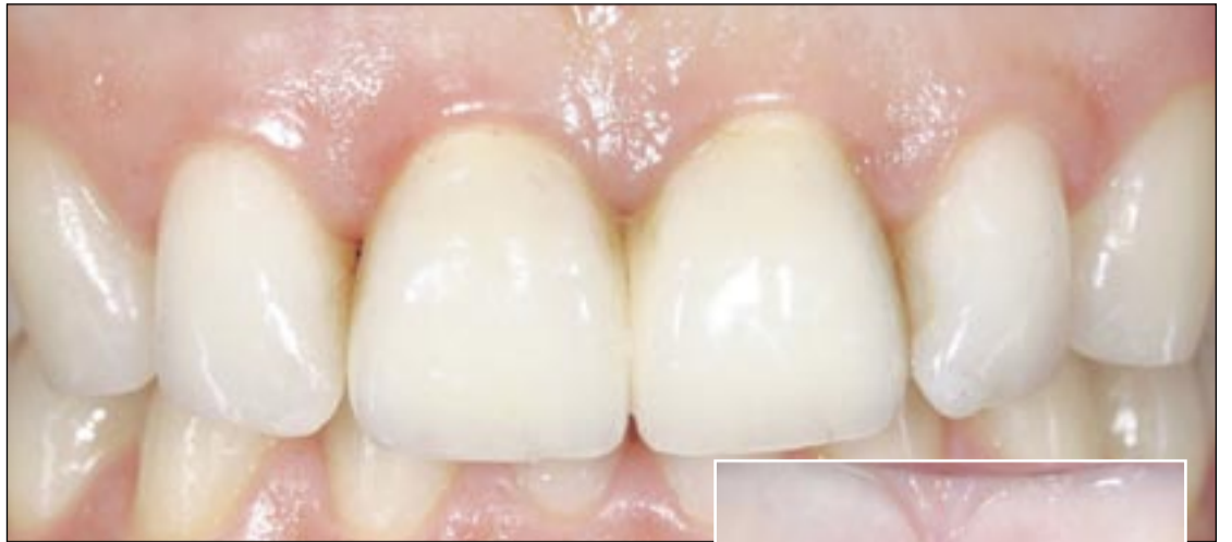
Eingesetzte Kronen mit vollständiger Regeneration des Zahnfleisches.